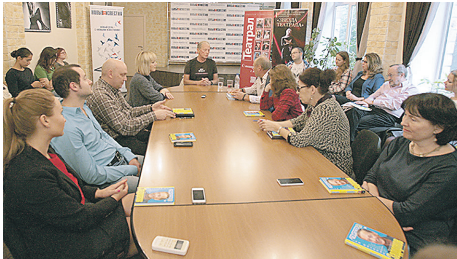
Михаил Задорнов на редакционной летучке «НИ».

Международный Совет Рериховских организаций имени С.Н. Рериха (Россия, Москва), Пермское региональное отделение Международной Лиги защиты культуры (Россия, Пермь), Общественное объединение «Культурный Центр имени Н.К. Рериха» (Казахстан, Алматы), представители 67 общественных организаций из 11 стран мира