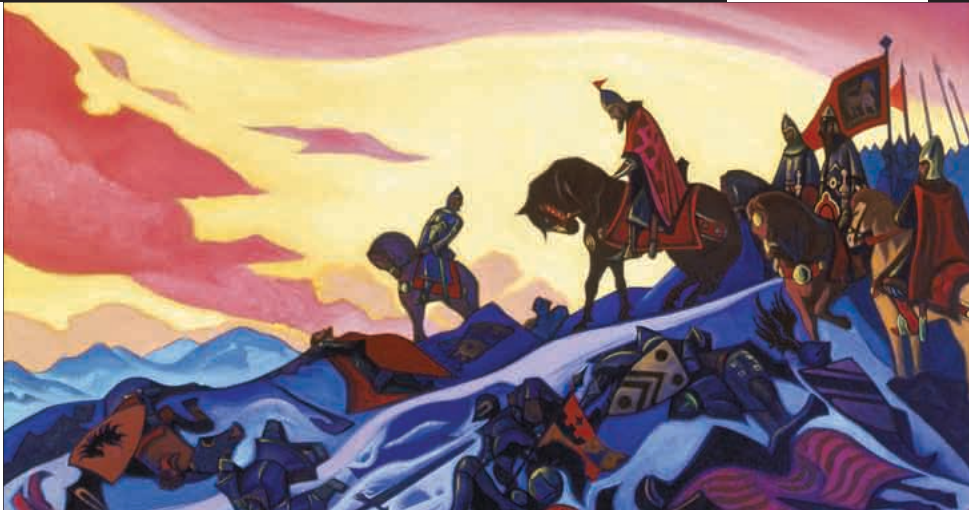
Н.К. Рерих. Александр Невский, 1942. Картина должна быть в России, однако находится за рубежом в частной коллекции

В этом же документе содержатся два принципиальных для нас момента. Во-первых, при жизни Святослава фонд получал право лишь распоряжаться наследием, но без права собственности. Права собственника С.Н. Рерих оставил за собой. И только после его смерти исключительные права на наследие должно было перейти к фонду (п. 5). Как показало время, это было мудрое решение.